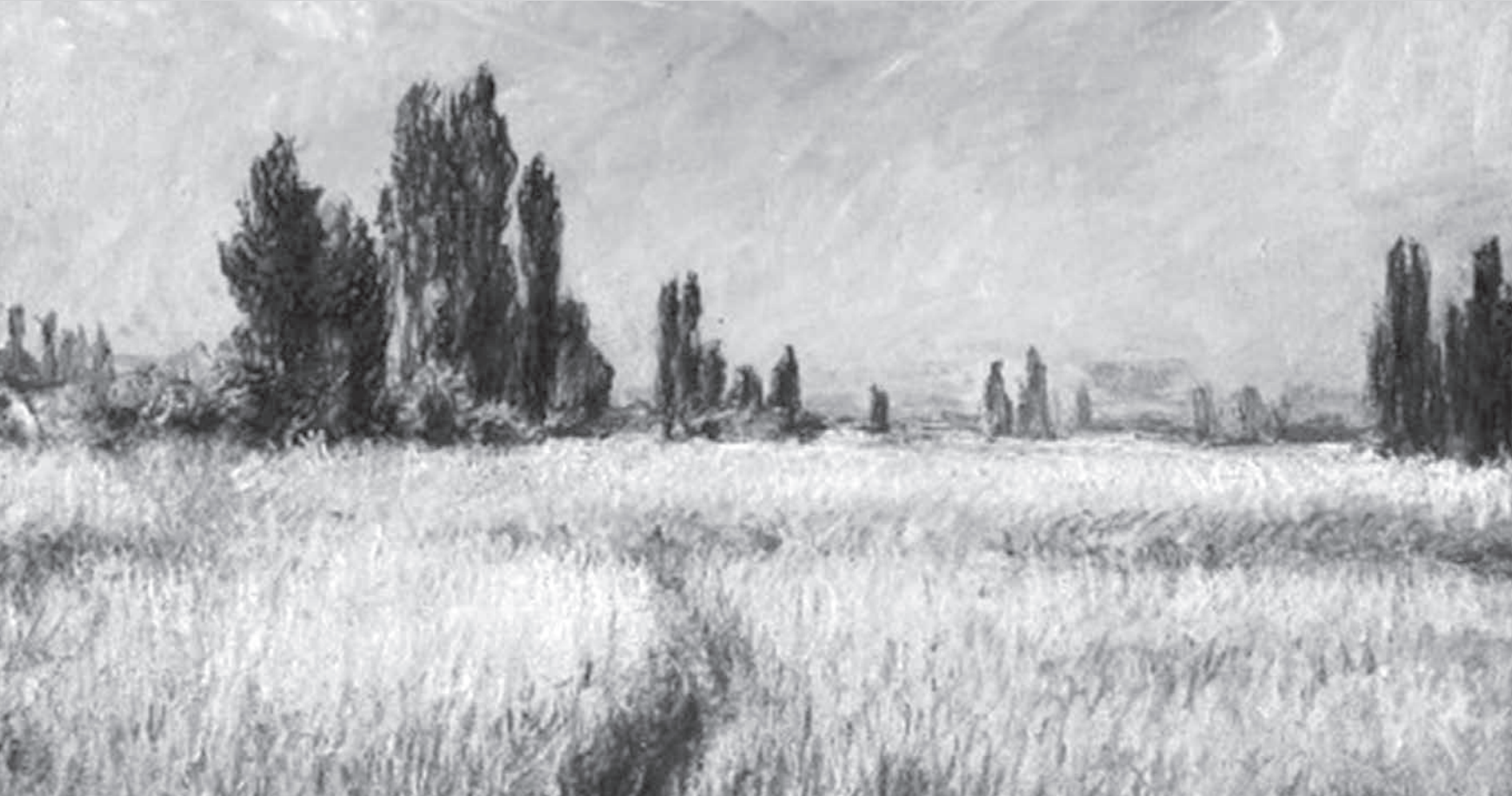
Das Titelbild des Abreisskalenders 2016: «Champ de blé» von Claude Monet.